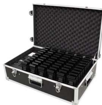
Maleta para cargar hasta 60 receptores (GX-60)