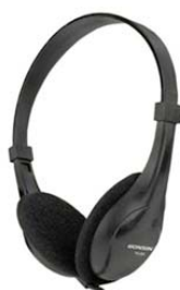
Auriculares (opción) TC-D3