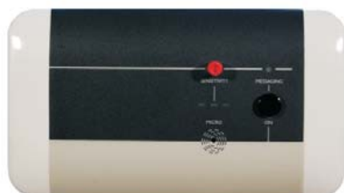
2694 Micrófono de pared

2693 Micrófono de avisos con sistema de inhibición, para el caso de que varios estén trabajando sobre la misma zona de altavoces (habitual en las consultas médicas), y función de "salida piloto pase", con temporización ajustable. Adecuados, por ejemplo, en la gestión de avisos a salas de espera. 2694