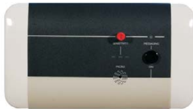
2694 Wall microphone