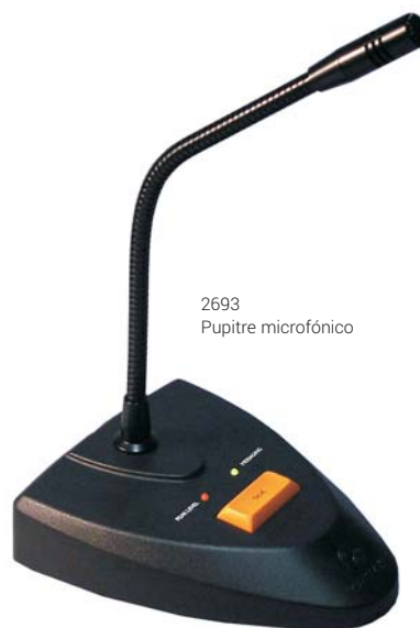
2693 Pupitre microfónico