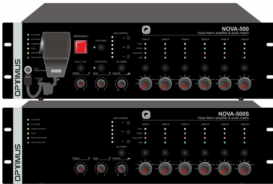
*NOVA-500 Amplificador principal